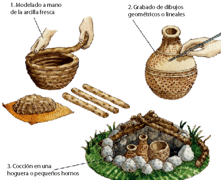
Proceso de fabricación de cerámica neolítica (tomado de internet: www: kalipedia.com/kalipediamedia/historia... ).

al final de esta etapa, la usaron para fabricar representaciones figuradas.