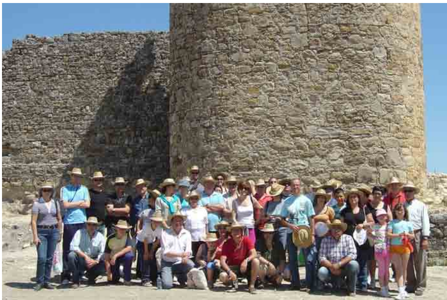
Alumnos de 5º curso del colegio público Valverde y Perales.