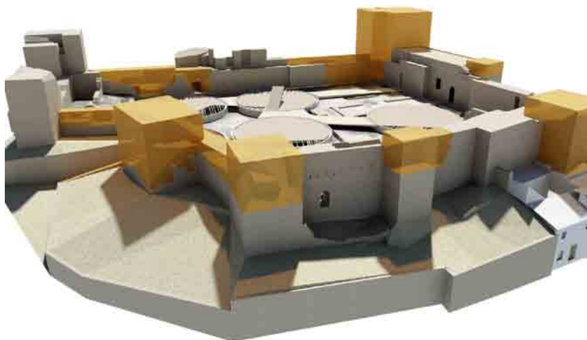
Recreación en 3D del Castillo de Baena

fase del proyecto de consolidación y restauración de la fortaleza, en el segundo, hay que destacar la adquisición por parte del consistorio baenense de la última parcela del yacimiento que aún estaba en manos privadas y los espectaculares resultados de la actual campaña de excavación, y respecto del Museo decir que, en breve, se acometerá también la primera fase de las obras encaminadas a rehabilitar y adecuar el Museo, conforme a la nueva legislación vigente.