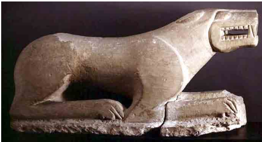
León ibérico del Cerro del Minguillar (MAN).

El Museo Arqueológico Nacional de Madrid posee entre sus colecciones diversas piezas procedentes de varios yacimientos baenenses. Entre ellas destacan un grupo de hasta seis esculturas ibéricas que representan leones. De ellos el más conocido es el inventariado con el número 20418. La pieza original tiene unas dimensiones, según los datos que figuran en la ficha de inventario del Museo son: de 95 cms de longitud, 51 cms. de altura y 26 cms. de grosor. Se trata de una escultura exenta que representa a un león echado, con la boca entreabierta de la que cae la lengua sobre la mandíbula inferior. Las orejas son acorazonadas y están pegadas a la cabeza, dejando su lóbulo interno surcado por incisiones. El cuello es liso, sin indicación de la melena. Las patas son delgadas y terminan en