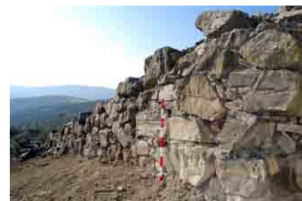
Estado final de un tramo de la muralla oriental tras los trabajos de limpieza.