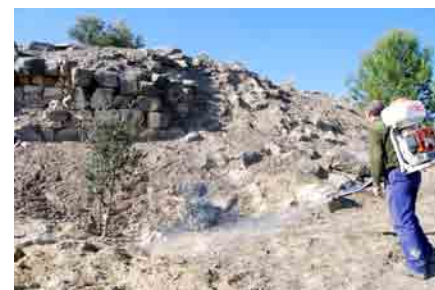
Aplicación de herbicida sobre los restos tras la limpieza.

químicos (herbicidas) para evitar el rebrote de la vegetación eliminada. El herbicida es un producto fitosanitario utilizado para matar plantas indeseadas. Los herbicidas selectivos matan ciertos objetivos, mientras preservan la cosecha relativamente indemne. Los productos empleados han sido el glifosato y el oxifluorfen 24 %. El glifosato es un herbicida no selectivo de amplio espectro, desarrollado para eliminación de hierbas y de arbustos, en especial los perennes. Es un herbicida total, siendo absorbido por las hojas y no por las raíces . La aplicación de glifosato mata las plantas debido a que suprime su capacidad de generar aminoácidos aromáticos.