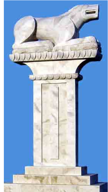
Monumento al león ibérico en la glorieta situada junto a Carrefour

Valenzuela (A-305), en una rotonda creada ex professo junto al centro comercial Carrefour y de fácil comunicación con la variante de la N-425. El autor de dicho monumento fue el artista cordobés José Manuel Belmonte.