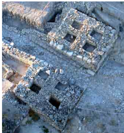
Panorámica aérea de la puerta oriental

musealización se colocarán réplicas de la columna sacra, altares y algunos exvotos. El objetivo final pretende la reintegración espacial del edificio sacro con la mínima intervención, de manera que permita la comprensión volumétrica al visitante, al tiempo que se protegen los muros interiores y pavimentos de la intemperie.