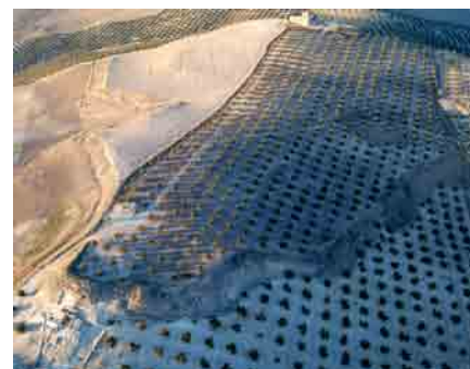
Foto general del yacimiento.