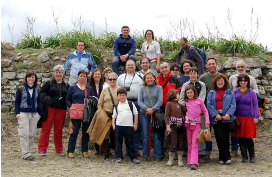
Visita de la Asociación de Amigos del Museo de Priego.

la Consejería, para este año 2009, ya figura Torreparedones junto con el resto de espacios incluidos en la citada Red. La programación de actividades se plantea a dos niveles; por un lado, a nivel de cada uno de los espacios integrados en la Red y por otro, de forma conjunta, con el fin de cumplir los objetivos generales y propiciar el intercambio de información y conocimiento entre los diferentes espacios.