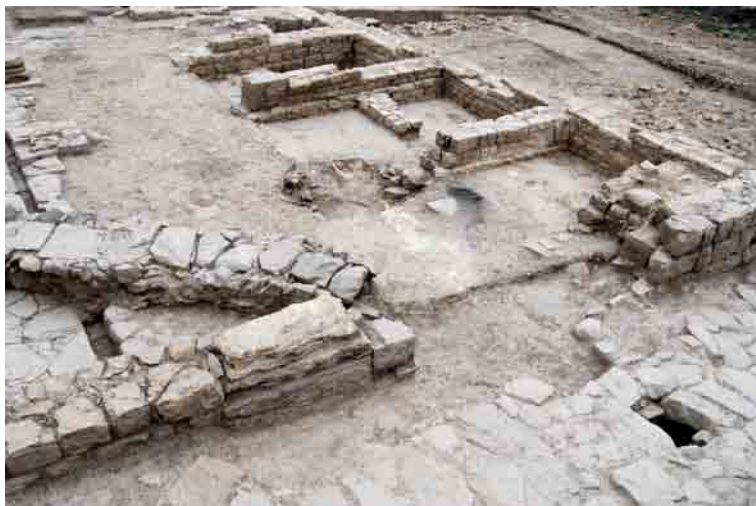
Vista parcial del macellum.