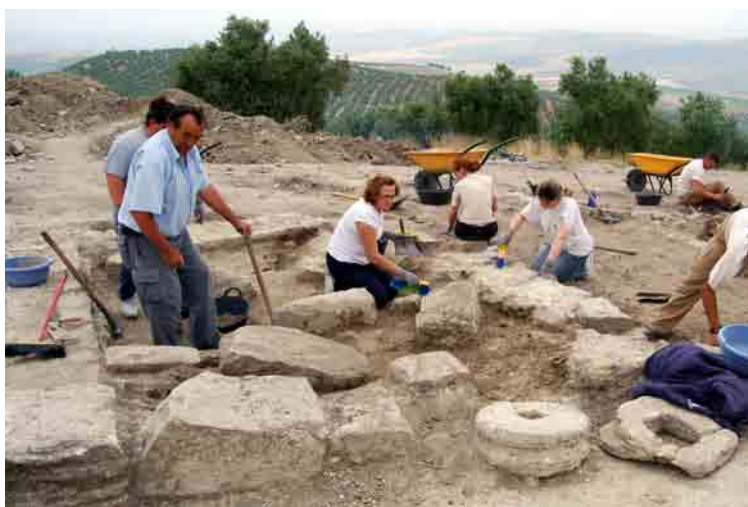
Excavación de una de las tabernae del mercado.

Este hecho constituye un hito importante en la historia del yacimiento y un paso fundamental en el desarrollo del proyecto del parque arqueológico. De forma inmediata se procederá al vallado de esta nueva zona eliminando la valla que hasta ahora dividía de norte a sur el lugar, de una manera artificial. El Ayuntamiento baenense ha propuesto a su vecino de Castro una estrecha colaboración para sacar adelante el parque, aunando esfuerzos, con la convicción de que en poco tiempo comenzarán a verse los beneficios que para ambos municipios y, en general, para toda la comarca reportará este foco turístico y cultural que es Torreparedones.