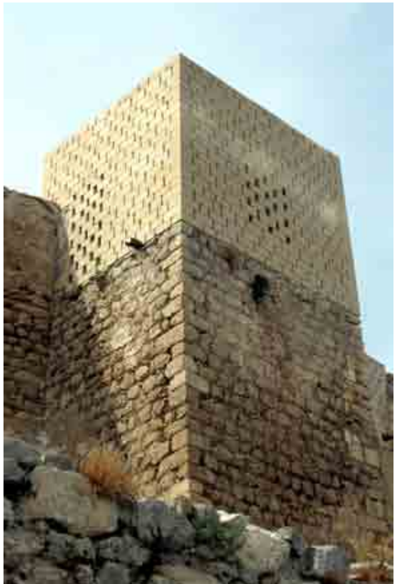
Restauracion de una de las torres del lienzo norte del castillo

Las intervenciones que se desarrollan en el castillo de Baena, pretenden no solo recuperar el patrimonio que representa este monumento, sino además, ponerlo al servicio de la industria turística de Baena, dentro del proyecto BaenaCultura, así como revitalizar el casco antiguo gracias a gozar de una importante