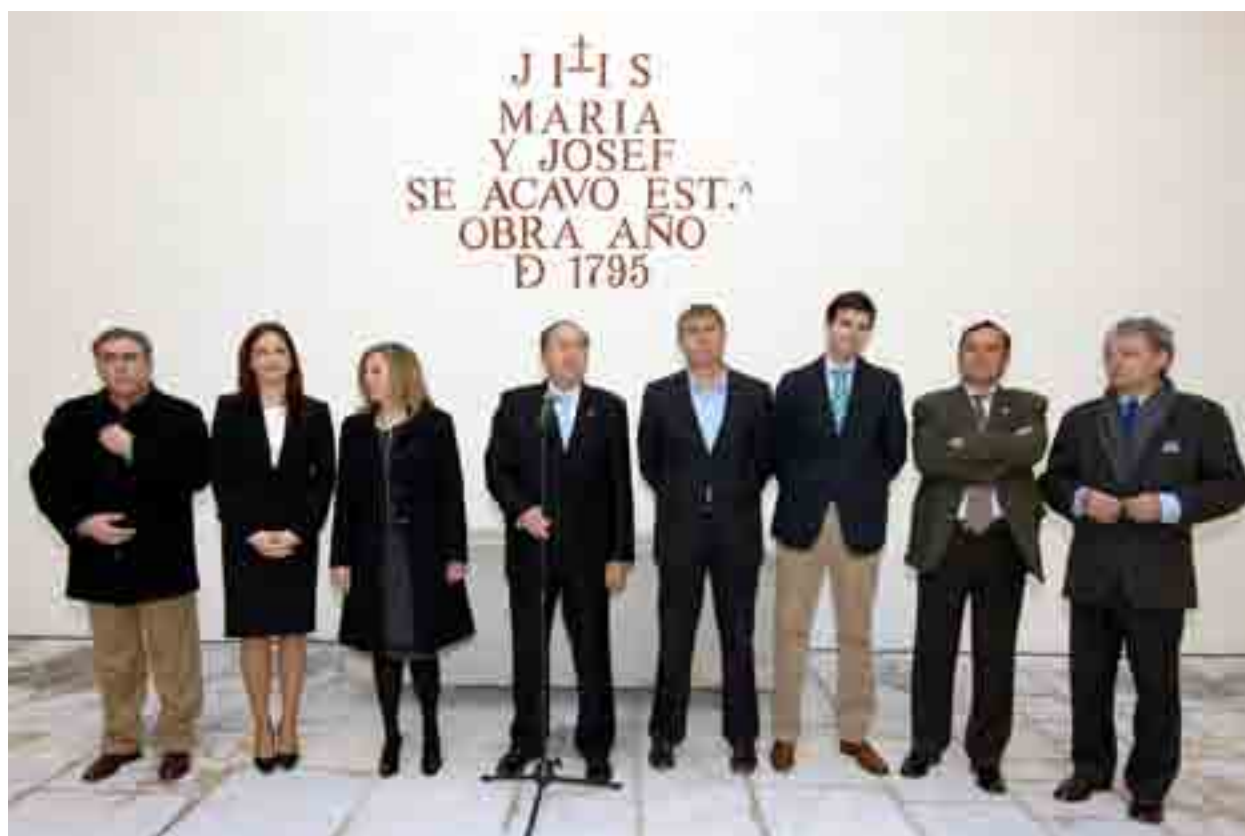
El alcalde, entre autoridades, y técnicos dirige unas palabras

en las excavaciones llevadas a cabo en Torreparedones”. Toda la Casa de la Tercia se ha destinado a Museo, sobre todo, a la exposición de sus fondos que se han incrementado de manera notable durante todo el período de obras debido a la expectación creada y