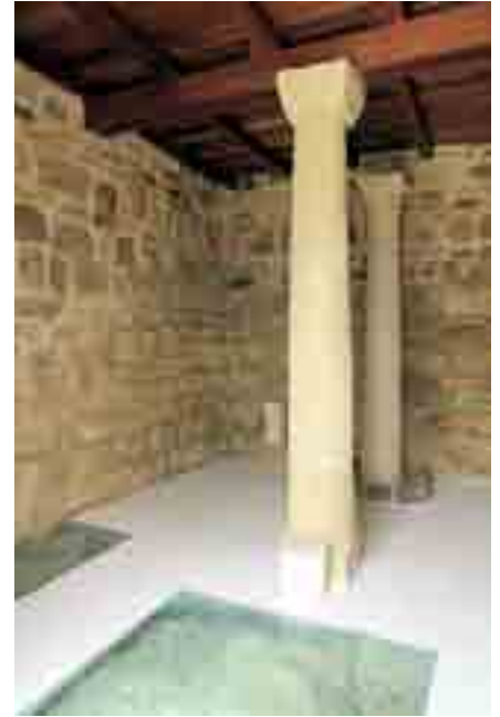
Cella del santuario

sectores hasta ahora investigados que son la puerta oriental, el santuario y la plaza del foro. Como botón de muestra del resultado final de esos trabajos se muestran algunas imágenes. La actuación más impactante quizás ha sido la referente a las torres que defendían la puerta oriental donde se ha optado por un recrecido importante con el fin de mostrar al visitante la volumetría de ambos