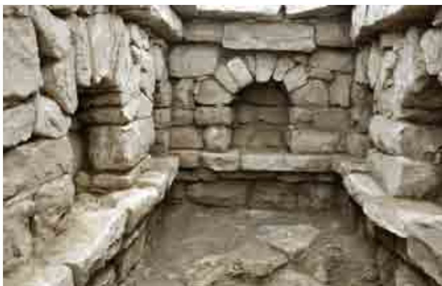
Detalle de una de las tumbas hipogeas

En cuanto a las inhumaciones, la tipología no es muy variada, pues en la mayoría de los casos se trata de fosas simples excavadas