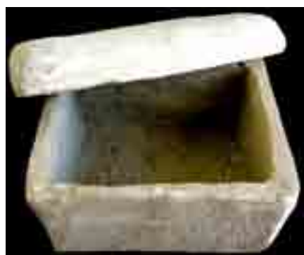
Urna cineraria romana