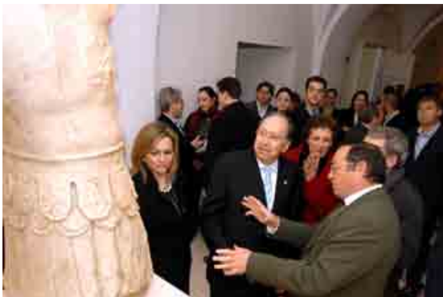
Un momento de la visita en la Sala II dedicada a escultura romana