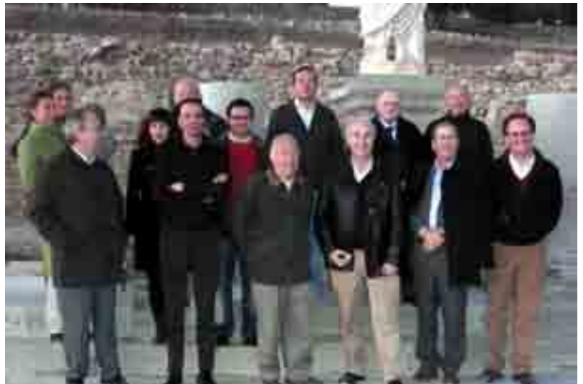
Visita de los autores (y acompañantes) del libro sobre el Mausoleo de los Pompeyos