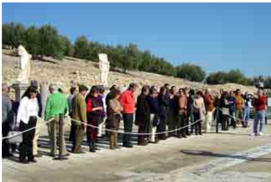
Un momento de la visita al foro romano

Expertos de varias universidades han realizado junto a la zona del foro romano, un experimento encaminado a determinar el Norte verdadero, la línea de referencia con la que los agrimensores romanos debieron diseñar el entramado urbano de la ciudad cuando esta se fundó sobre la antigua urbe ibérica. El proyecto dirigido por Margarita Orfila, catedrática de Arqueología de la Universidad de Granada y M a Esther Chávez de la Universidad de la Laguna, incluido dentro del Plan Nacional de I+D+I del Ministerio de Ciencia