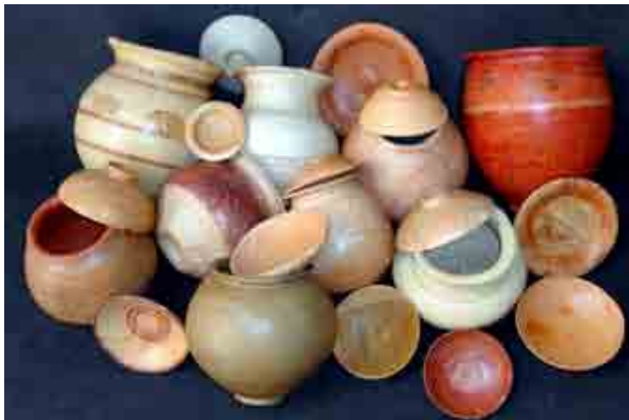
Conjunto de cerámica ibérica

también como consecuencia de las excavaciones que se vienen realizando en el yacimiento de Torreparedones.