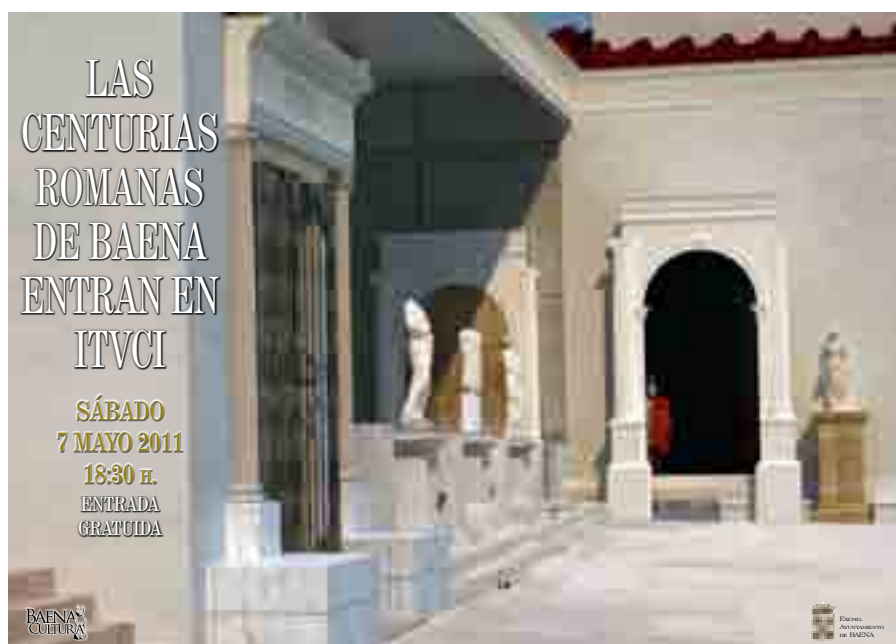
Cartel de las centurias romanas en Torreparedones

Desde el Museo, además de este boletín “Baena arqueológica” que tiene un carácter más bien divulgativo de todo lo relacionado con el patrimonio histórico y arqueológico de la localidad, se ha puesto en marcha otro proyecto editorial encaminado a la publicación de estudios monográficos. Se trata de la revista SALSVM que se edita con la colaboración económica de la Excma. Diputación Provincial. Ese era el nombre con el que se