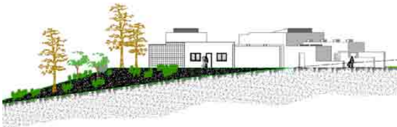
Alzado oeste del centro de recepción de visitantes

Una vez adquiridos los terrenos necesarios ya han comenzado las obras del centro de recepción de visitantes y de interpretación del parque arqueológico de Torreparedones. La zona está ubicada a unos