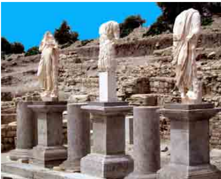
Pórtico norte del foro

por investigadores interesados en conocer la singular técnica constructiva interna que presentan, muros en cruz que genera cuatro compartimentos similares que estaban rellenos piedra y cascote. Este curioso y a la vez raro sistema debió servir para ahorrar materiales, para atar los muros perimetrales de las torres dotándolas de mayor consistencia y, muy probablemente, también para servir de apoyo a un pilar central que sostendría el techo de una segunda planta. En cuanto al acabo exterior de la restauración se considera adecuado ese aplacado de piedra en hiladas horizontales, aunque debería ofrecer un aspecto más irregular y no tan industrial, con un llagueado mínimo entre las piezas. Además, esa reconstrucción permitirá visitar el interior de alguna de las torres no sólo para ver el sistema constructivo del muro en cruz sino también para entender esa cámara superior destinada a cuerpo de guardia.