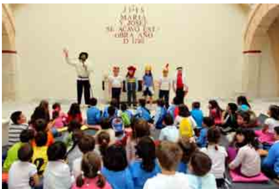
Representación de cuentacuentos en el patio del Museo

Dentro de las actividades difusión del patrimonio histórico baenense hay que mencionar la participación en varios congresos en los que se ha dado a conocer la importancia del parque arqueológico de Torreparedones. Así, y con motivo de la celebración del