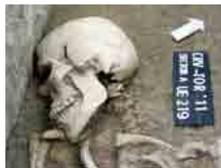
Detalle del cráneo del militar romano

de altura. Se han documentado algunas lesiones óseas relacionadas con actividades cotidianas o repetitivas, en las que suelen implicarse algunas partes del cuerpo de forma continuada, tales son huellas de acucillamiento detectadas en el tobillo derecho, sobreextensión de la articulación de la cadera por flexión y extensión continuada de las piernas a partir del muslo y una musculatura muy marcada en cuello y hombro. También presenta algunas evidencias de enfermedades padecidas como hernias en columna dorsal y lumbar, artrosis en columna cervical, dorsal y tobillo