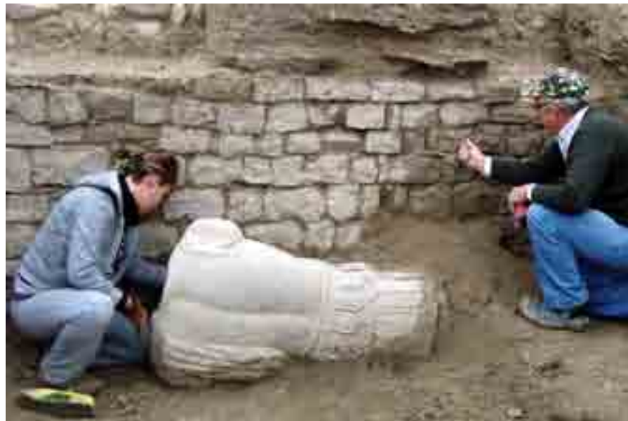
Hallazgo de la escultura thoracata

los primeros días de trabajo, que se centraron en la zona del pórtico norte, se encontró una de las piezas más espectaculares que viene a completar aquel grupo escultórico marmóreo recuperado en la campaña anterior compuesto por el retrato de Claudio, Livia y Tiberio. En esta ocasión se ha encontrado el torso de una escultura thoracata, es decir, una estatua