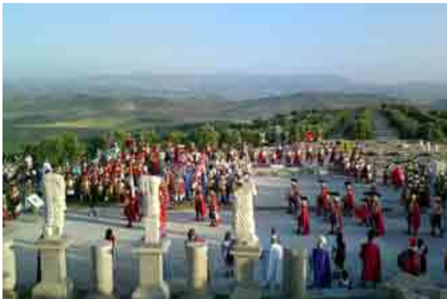
Aspecto del foro de Torreparedones con las centurias romanas