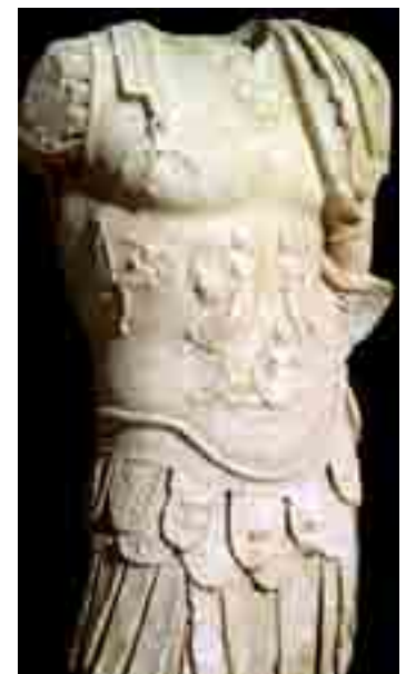
Escultura thoracata de Torreparedones

También se está avanzando en la difusión con una presencia importante en congresos, reuniones, jornadas, etc. para dar a conocer los resultados de las