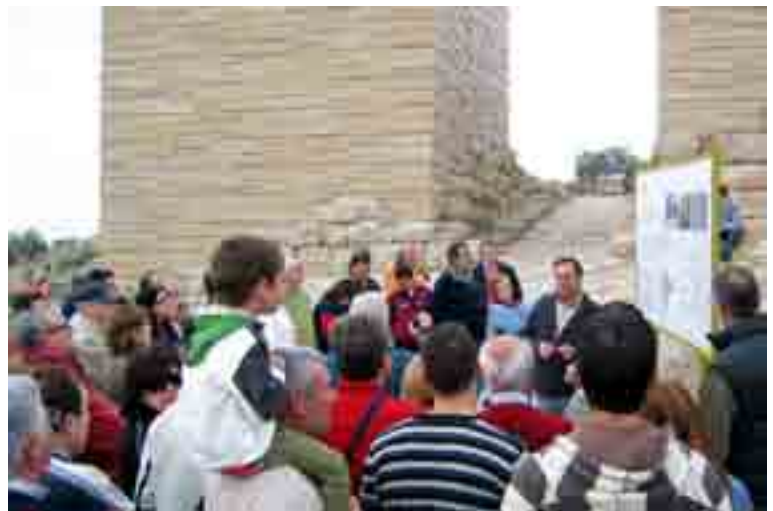
Visita de la Asociación Bursavolense de Arte, Arqueología e Historia