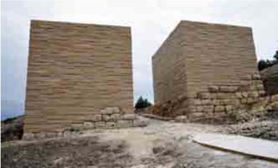
Panorámica de la puerta oriental