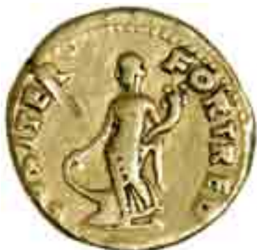
Aureo de Vespasiano