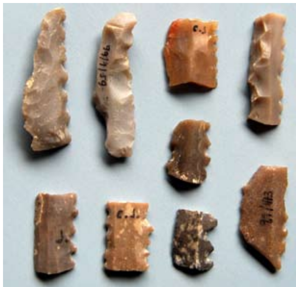
Dientes de sílex.

La reconstrucción de la hoz es ideal, pero se ha hecho siguiendo el modelo realizado por G. Bonsor para el yacimiento sevillano de El Acebuchal en 1899. Los dientes de sílex son unas láminas pequeñas con uno de los bordes dentado y afilado. El dentado se conseguía practicándoles una o varias muescas. Estas piezas eran encajadas y sujetadas en una madera unas junto a otras con resinas y, dado su pequeño tamaño, pueden adoptar una forma curva para generar la hoz. Estos dientes suelen presentar en el filo cortante un brillo intenso o pátina como consecuencia de un uso prolongado. En el término de Baena son muchos los yacimientos en los que se encuentran este tipo de piezas, en especial, en poblados de la Edad del Cobre y del Bronce: Cerro de Jesús, Tiñosa, Cerro del Gujarral, etc.