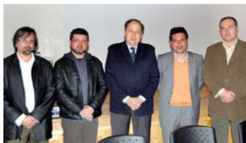
Participantes en el acto.

intervención en el castillo pretende, por tanto, reconocer la fortaleza desde una perspectiva global y contemporánea que sitúe al monumento en su actual contexto, respetando el estado actual