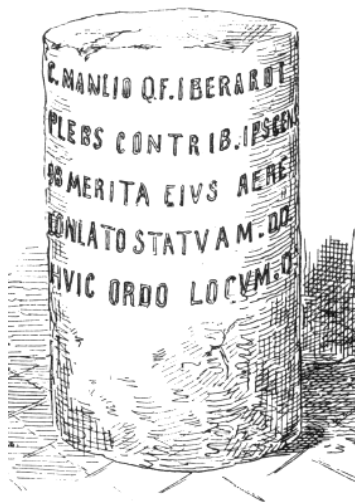
Pedestal de estatua dedicado a Cayo Manlio Paridi (según Valverde y Perales).

Esta pieza parece que fue reutilizada posteriormente como pie de altar, quizás en época visigoda o posterior pues en la base se aprecia un doble rebaje de forma