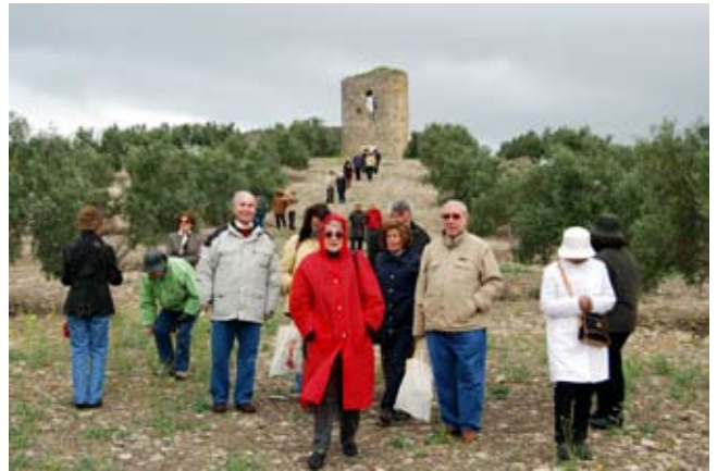
Visita de la Asociación Española de Amigos de la Arqueología.

como prueba de gratitud y a cambio de haber obtenido el favor solicitado. Este monumento, junto a otros que van salpicando la geografía urbana baenense (crismón de Izcar, león del Minguillar) es una muestra más del compromiso del Ayuntamiento por recuperar y difundir ese patrimonio arqueológico tan excepcional que diversas culturas y pueblos dejaron en estas tierras.