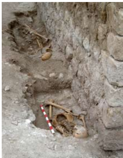
Inhumaciones recientes junto a una de las torres del castillo.

En la fachada N. la actividad arqueológica ha facilitado nuevos datos sobre la estructura de la Torre de los Cascabeles, aunque todavía no se ha podido precisar