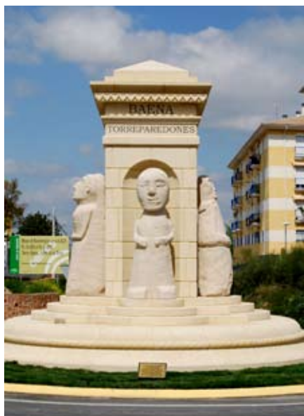
Monumento a los exvotos de Torreparedones.

El 28 de marzo se ha inaugurado el monumento levantado al santuario ibero-romano de Torreparedones, uno de los elementos más significativos que se conoce en la actualidad de dicho yacimiento arqueológico. El lugar escogido para su ubicación ha sido la glorieta existente entre las avenidas de Cañete de las Torres y San Carlos de Chile, justo en el que en breve se convertirá en el acceso más importante de Baena, desde la variante de la N-425. El monumento es obra del escultor cordobés José Manuel Belmonte y está realizado