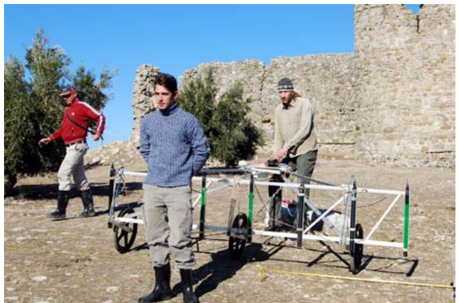
Trabajos de prospección geomagnética.

Las investigaciones han permitido conocer el entramado urbano de la antigua ciudad con la ubicación y orientación de las edificaciones y el viario. Con georadar se han estudiado 2 hectáreas del asentamiento y ha sido posible determinar la presencia de estructuras arqueológicas desde la superficie hasta -1,5 m. con plenas garantías. Quizás, lo más interesante ha sido la confirmación de un importante eje viario que comunicaría la puerta oriental con la occidental, un decumanus maximus junto al cual podría ubicarse el foro de la ciudad romana. En cuanto a la necrópolis N., la información disponible es menor pero de gran interés por cuanto los datos aportados podrían ayudar a determinar la ubicación del “Mausoleo de los Pompeyos”, una tumba monumental romana que fue descubierta en 1833. Se han detectado,