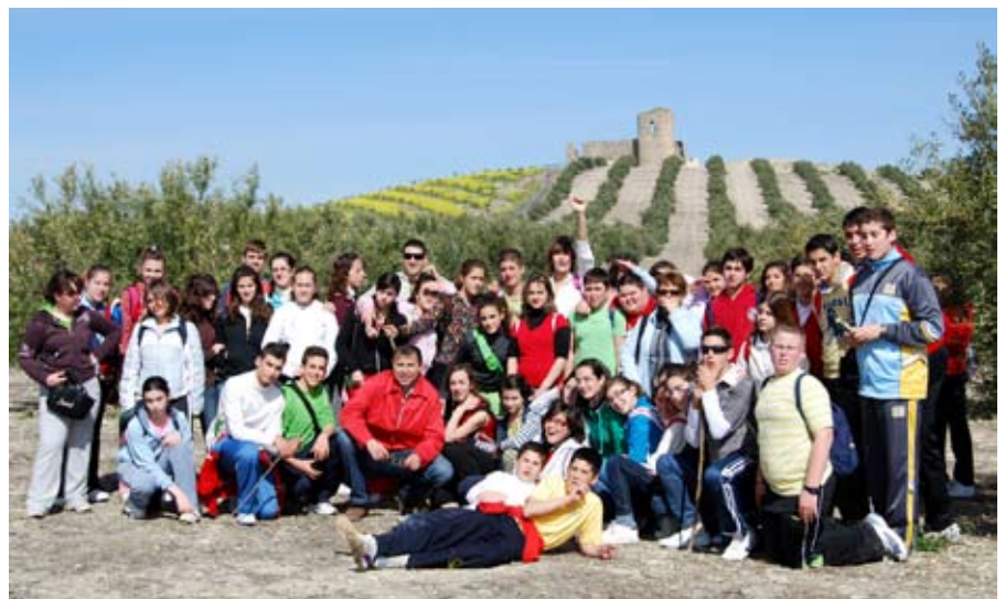
Visita de alumnos de 2º de ESO del IES Luis Carrillo Sotomayor.

hace 2.000 mil años. Se conservan restos de dos templos, la imagen de la divinidad allí adorada y sabemos su nombre Dea Caelestis/Juno Lucina . Era un santuario salutífero en el que los devotos que a él acudían buscaban una utilidad práctica: buena cosecha, curación de una enfermedad, parto feliz, etc., tratándose de un fenómeno que ha pervivido hasta nuestros días sin apenas variaciones; raro es el pueblo o ciudad andaluza, incluso española, que no tiene una ermita o un templo dedicado a su patrón o patrona a los que se dedican numerosos exvotos (láminas de metal, fotografías, miembros anatómicos...)