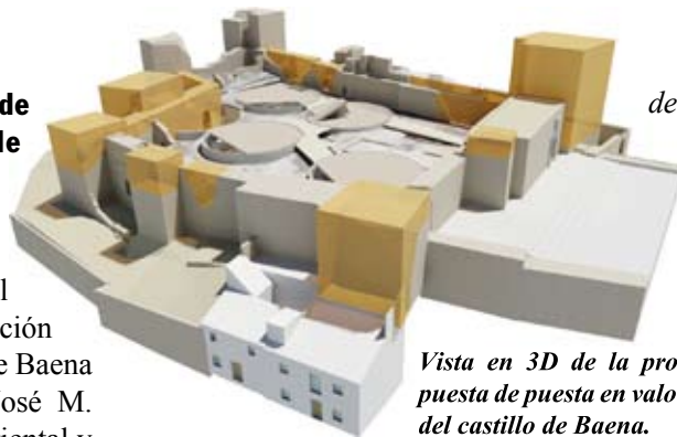
Vista en 3D de la propuesta de puesta en valor del castillo de Baena.

intervención en el castillo pretende, por tanto, reconocer la fortaleza desde una perspectiva global y contemporánea que sitúe al monumento en su actual contexto, respetando el estado actual