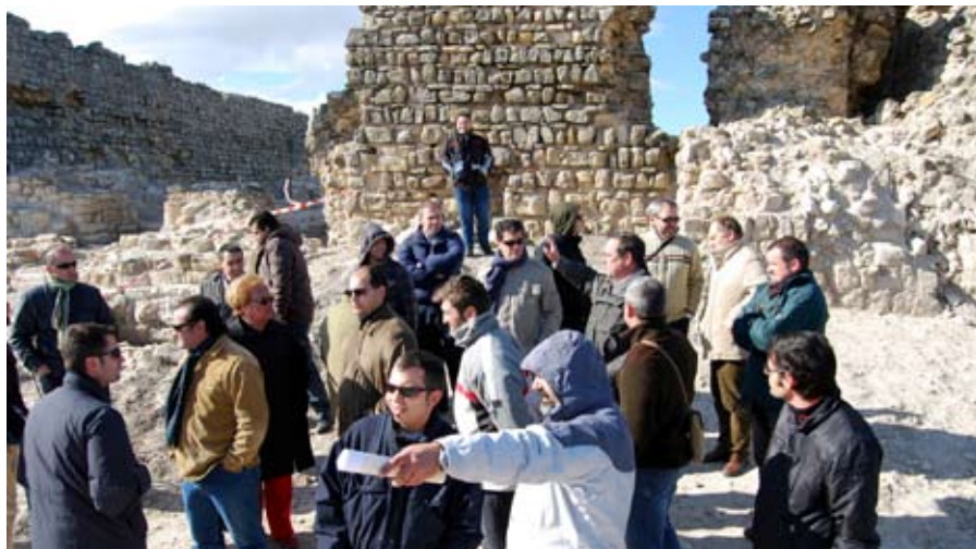
Participantes en el curso sobre Protección del Patrimonio Arqueológico.